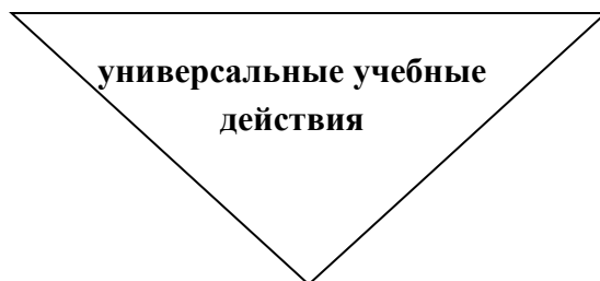
Рис. 4. Формирование УУД средствами внеурочной деятельности УМК «Перспективная начальная школа».

Описание связи УУД с содержанием конкретного учебного предмета строится по следующему плану: